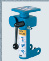
piastra adattatrice 4 (10 mm) kit di adattamento

* l'indicazione si riferisce a morsa HEUER